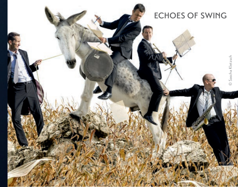
ECHOES OF SWING