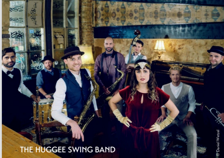
THE HUGGEE SWING BAND